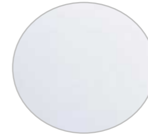
マイルドホワイト