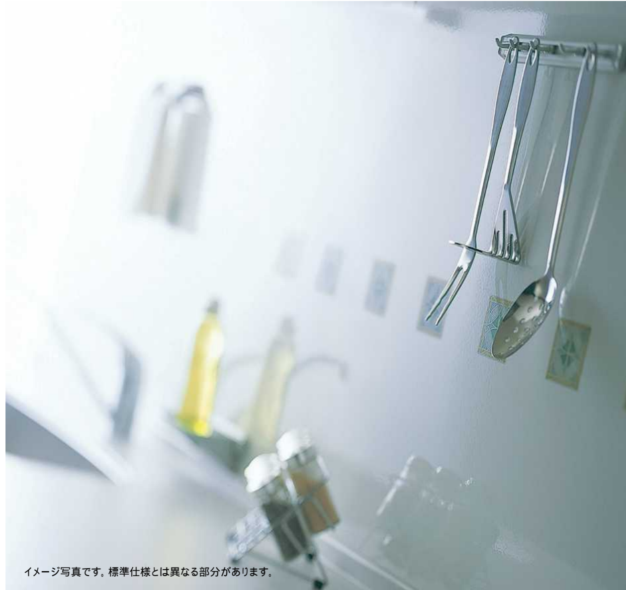
イメージ写真です。標準仕様とは異なる部分があります。