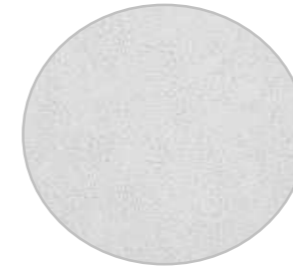
ロッシュホワイト