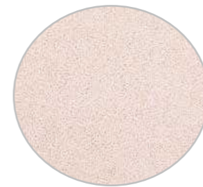
ロッシュベージュ